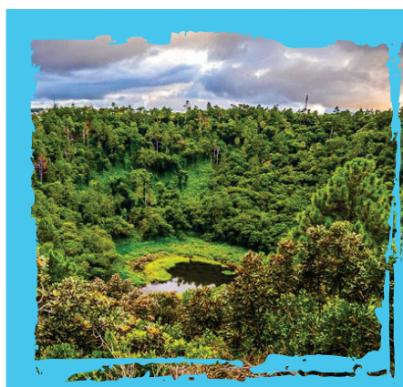
Trou aux cerfs