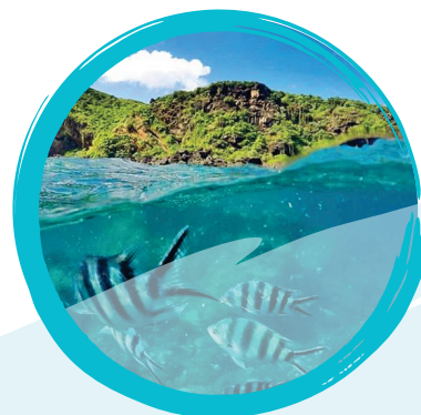
l'lot aux Gabriel