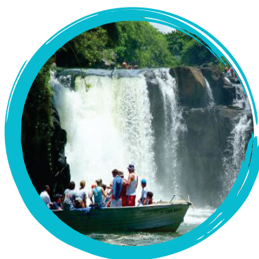
Cascade Grande Rivière Sud- Est