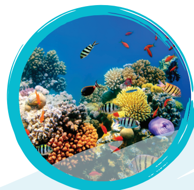
Récif de corail