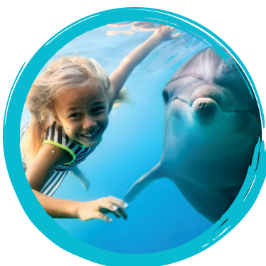
Nager avec les dauphins