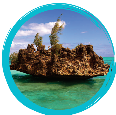
Ile aux Bénitiers